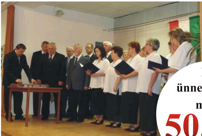
Világosi Népdalkör: balatoni dalszokor