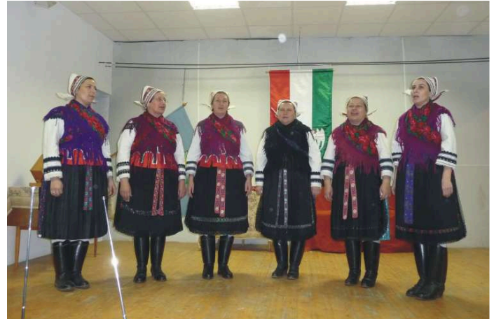
Gimesi Hagyományörző Csoport