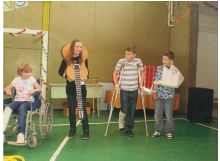
Az osztály, aki mrgküzdött a jó jegyért

A tavasz beköszöntö előtt azonban van még egy fontos esemény, a karnevál. Ilyenkor mindenki elfelejti, hogy mit is ünnepelünk ezen a napon, sokkal fontosabb a multság. Mint minden farsangi mulatságon, most is a jelmezes felvonulás volt a legfontosabb és legizgalmasabb a gyerekek számára. A zsűri rengeteg csokoládét osztott szét a gyerekek között, ami azt mutatja, hogy sok szellemes és érdekes jelmezzel illetve produkcióval örvendeztették meg a közönséget. Nagy sikere volt a 4. osztálynak, akik megmutatták nekünk, hogy mire képesek az ötös osztályzatért (bőségesen