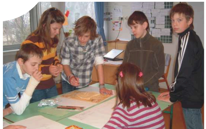
A feladatok gondolkodtatóak...