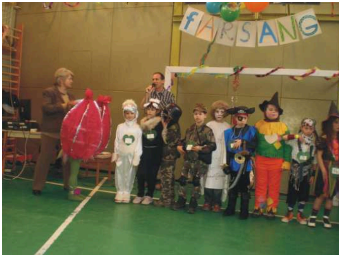
Az 1. osztály