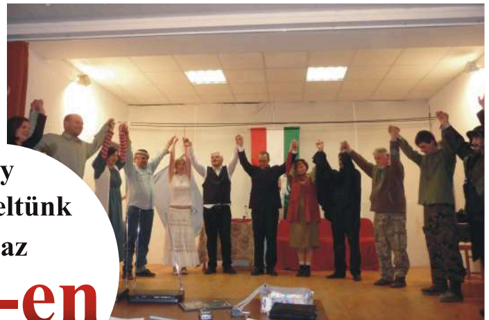
Alig(h)a Színjátszó Kör: Dr.Hertz musical