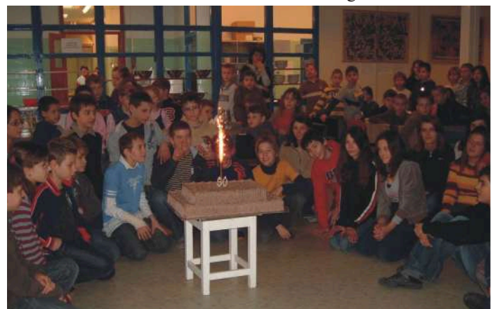
Jutalom: Az ünnepi torta