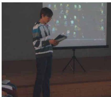
Kép és szöveg: MBGY