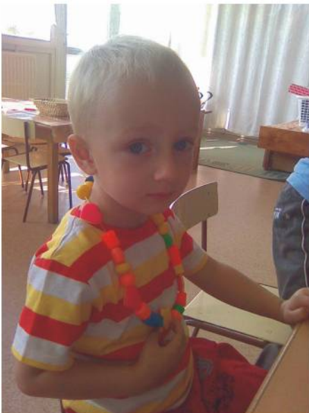
Szép a nyakláncom