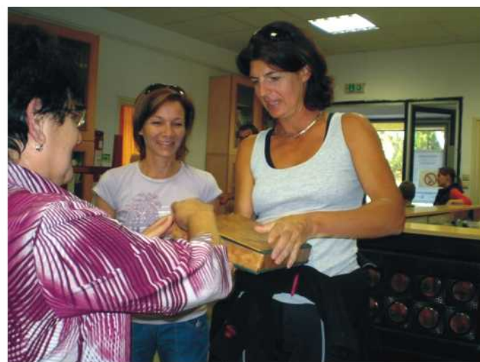
A Vándor Könyv átadása