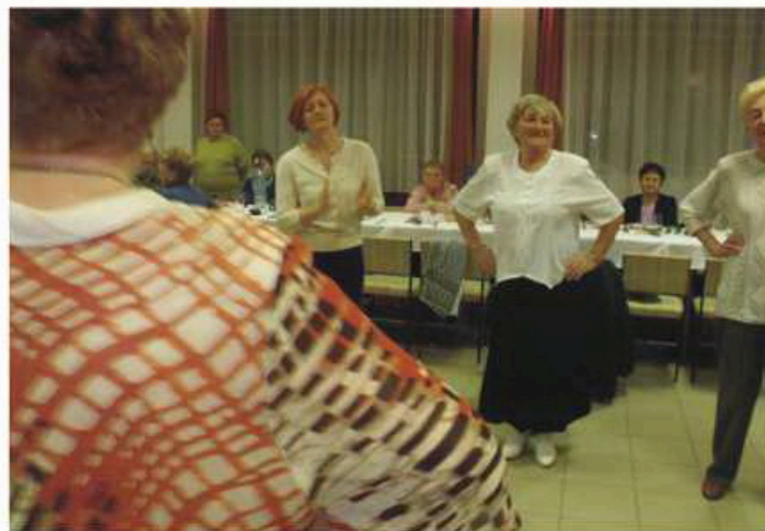
A jó zene és tánc...

Minden kedves Olvasónknak boldog új évet kívánunk!