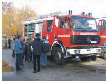
Érdekes a tűzoltó kocsi

A tanulók érdeklődéssel hallgatták a gondolatébresztő kiselőadásokat, feltették kérdéseiket, és szerintem nagyon el is gondolkodtak a kapott válaszokon. Meglepődtek, hogy milyen negatív hatása lehet az energia italoknak, hogy milyen nagy bajt okozhat a meggondolatlan cselekedetük, hogy hogyan és kik, miként