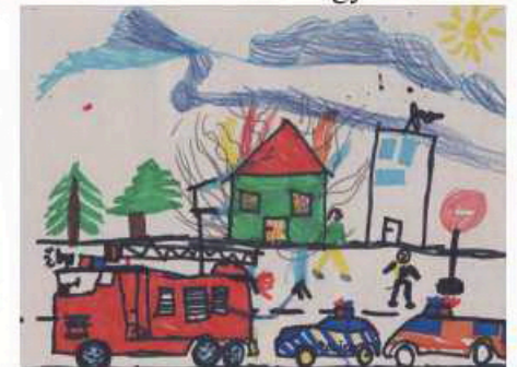
Jön a segítség · Bende Nimród 2.o.