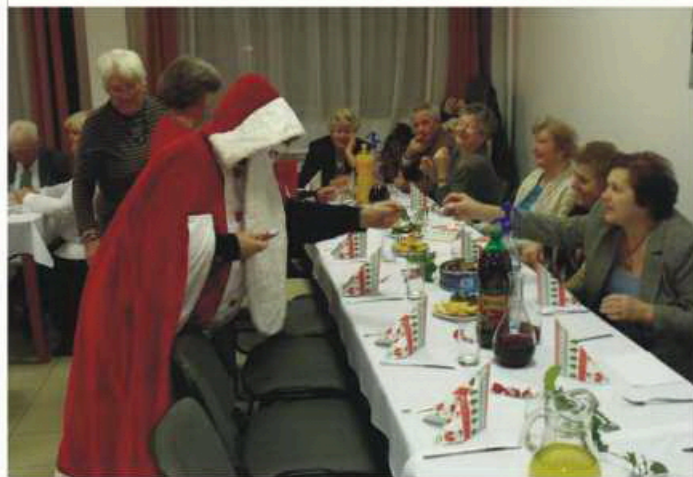
Megérkezett a Mikulás