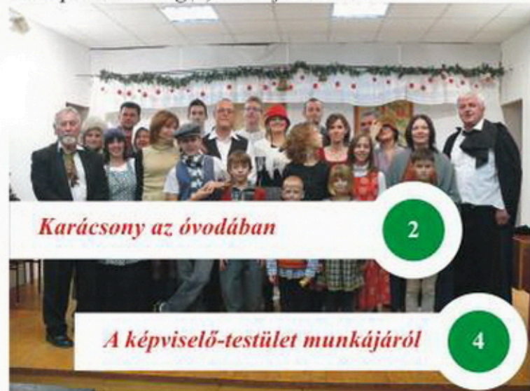
Karácsony az óvodában