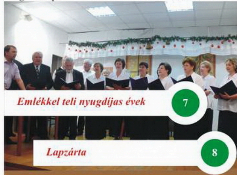
Emlékel teli nyugdíjas évek