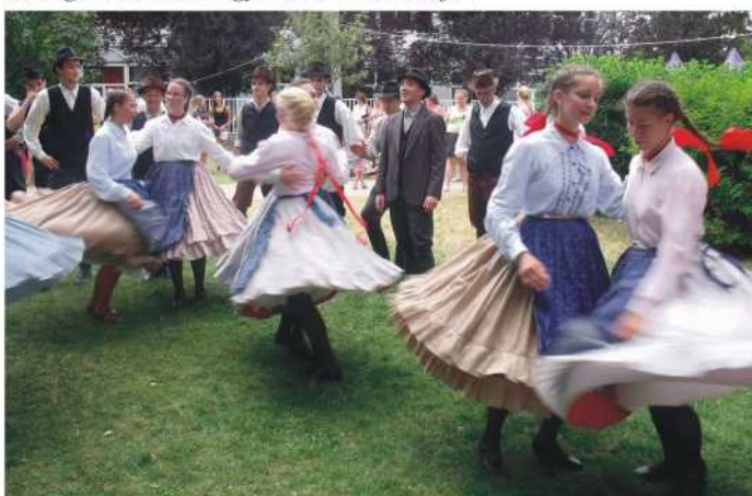
Siófoki Néptánc Egyesület