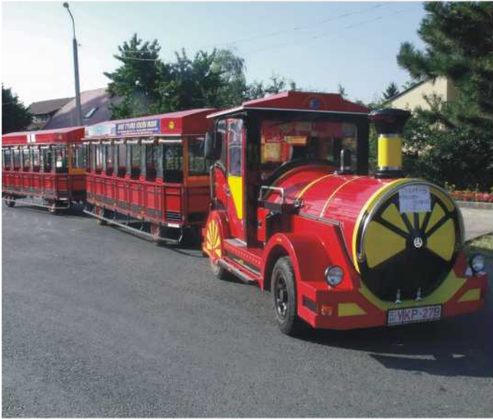
Thomas a balatonvilágosi gőzös