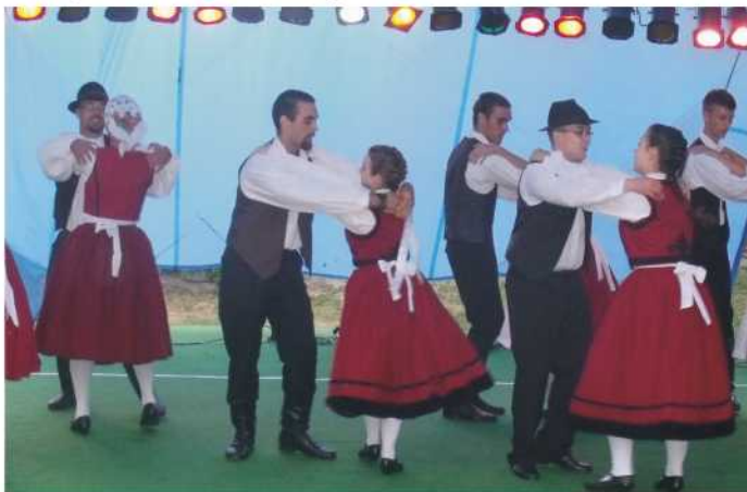
Ördögkerék Tánc Egyesület bemutatója