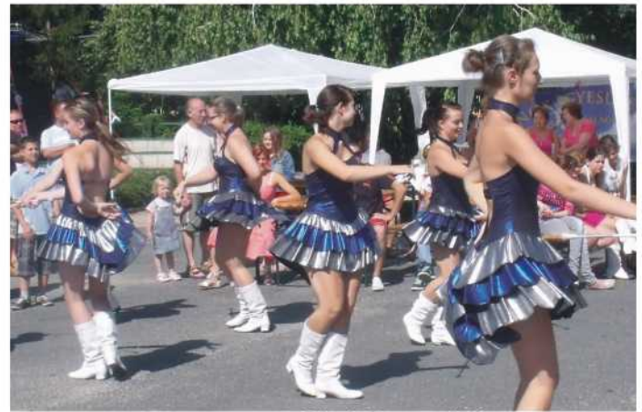
Black Diamond Mazsorett csoport