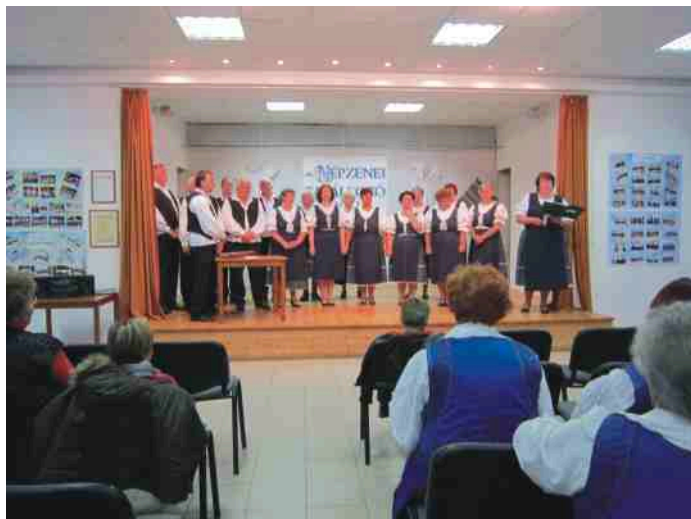
A Balatonvilágosi Népdalkör