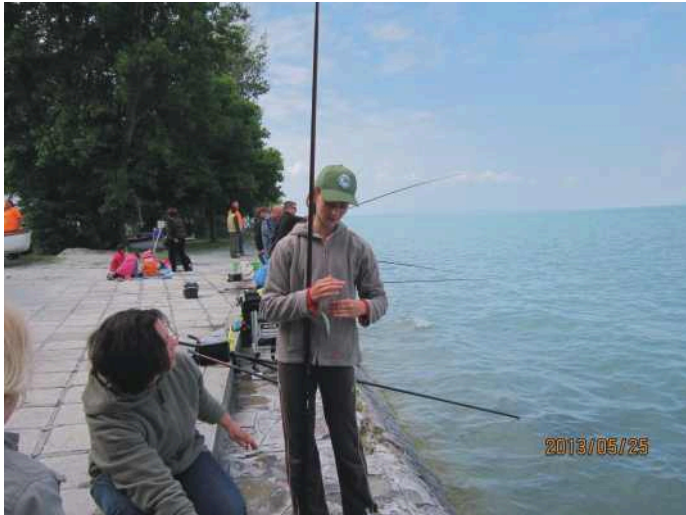
Horgászversenyen: Megvan a hal!