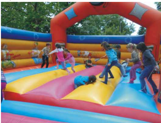
Az ugráló várban