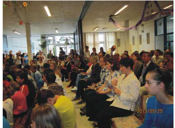
A közönség