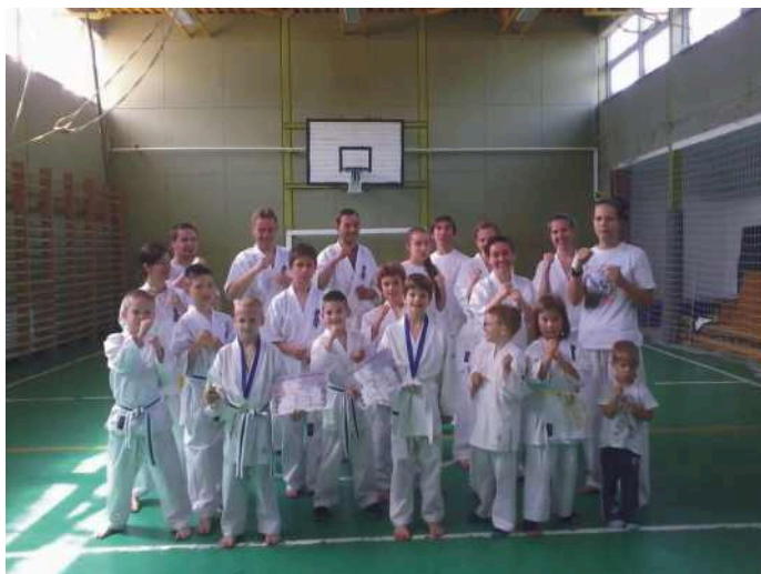
A nagy csapat

Szeretettel várunk minden kiállítót és érdeklődőt! Kézműves Szakkör tagjai