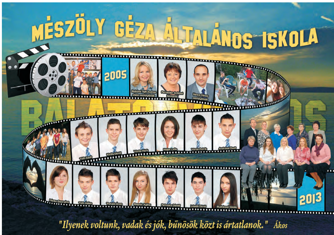
A ballagó 8.osztály tablója