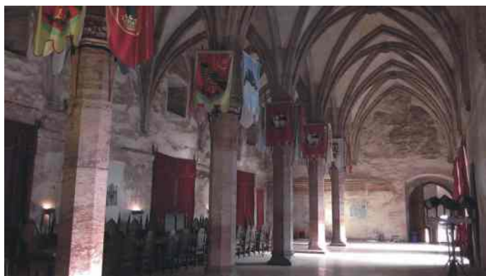
Vajdahunyad lovagterem, Máriaradna, Kegykép

Utolsó napunk is mozgalmas volt. A nagy pakolás után hazafelé megálltunk Vajdahunyadon és megnéztük a Hunyad-Bethlen várkastélyt. Elmentünk a Kárpát-medence Csíksomlyó után talán legfontosabb