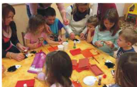
Családi barkács délután