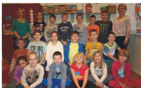
Bemutkozik a 3. osztály