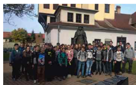
Határtalanul - II. Rákóczi Ferenc nyomában