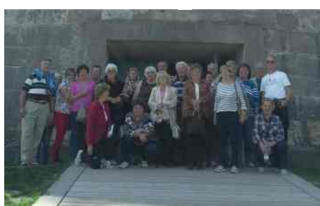
Változatos programok a Nyugdíjas Egyesületben