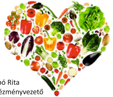
Szabó Rita intézményvezető