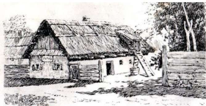
Petőfi szülőháza Kis-Kőrösön

Petőfi költészetének mai témája a szülőföld és tájköltészet . Tájleíró verseit és vallomását szülőföldjéről érzelmi telítettség, személyisége erőteljes jelenléte jellemzi. A bemutatott tájhoz bensőséges, szeretetteljes viszony fűzi. Megihleti a természet változatos rendje, végtelensége, hatalmas energiái, szépsége. Petőfi romantikus lírai személyiség volt, s festői volt a látásmódja is. A szavak erejével zseniálisan vissza tudta adni a szeretett táj szépségét.