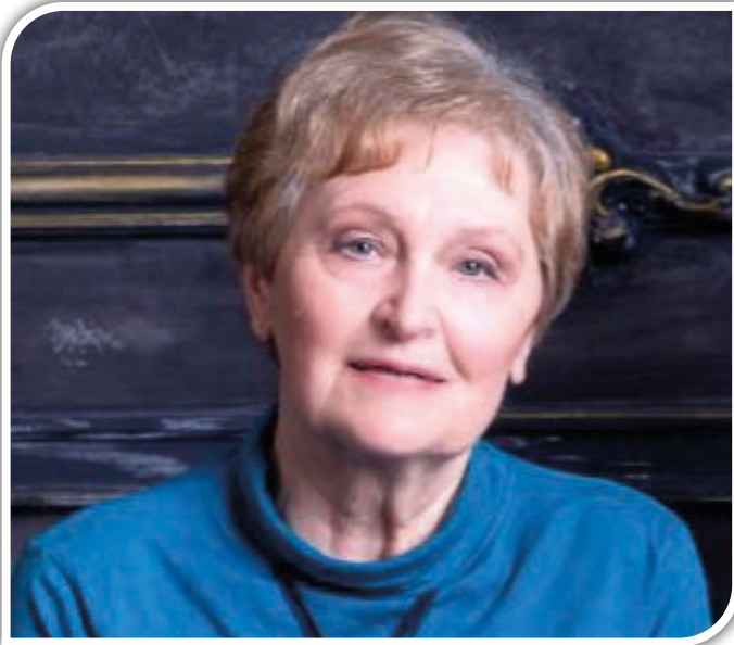
A riportot Horváth Bence, az Aligai Fürdőegyesület kommunikációs referense készítette.

-A fenti könyv tartalmával az Egyesület munkájába való szorosabb belefoglalásom során ismerkedtem meg, és már az első pár oldalt elolvasva is rögtön éreztem, hogy ez nem egy szokásos projekt, egy társadalmi munka kronologikus sorrendbe állítása és bemutatása, hanem egy elkötelezett életút története. Jól érzem, hogy Ön számára Balatonvilágos-Balatonaliga nemcsak egy nyaralóhely, hanem egy olyan hely is, aminek a szeretete arra készítette, hogy életéből több, mint harminc évet áldozzon az itt meglévő problémák megoldására?